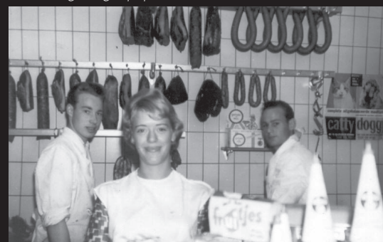
afbeelding: slagerij opa

Voordat ik een politiek ontwerp maak, wil ik goed onderzoeken wie ik hiermee aanspreek en wat de gevolgen voor de deze mensen kunnen zijn.